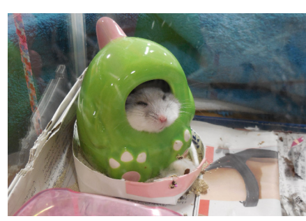
セラピーハムスターも大活躍！