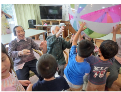
併設保育園との交流があります。