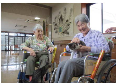
セラピー猫が2匹暮らしています。日々癒してくれています。